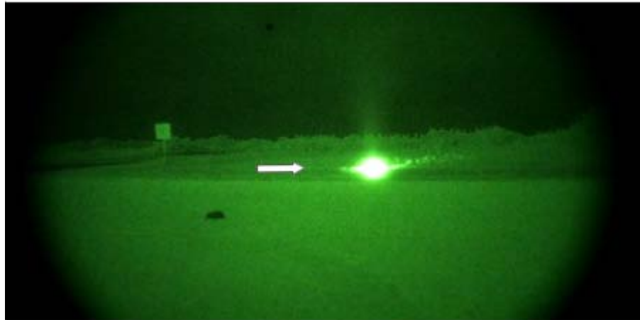
A burst of light during field work at Marco Island

February 3 - 9, 2013 www.EtContactNow.com