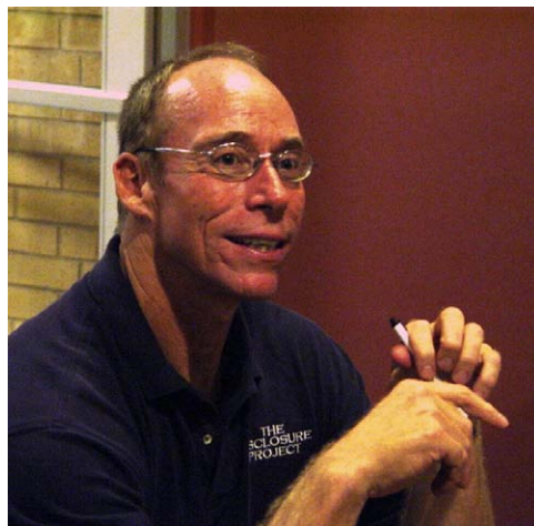
Historic Quotes shared with filmmakers